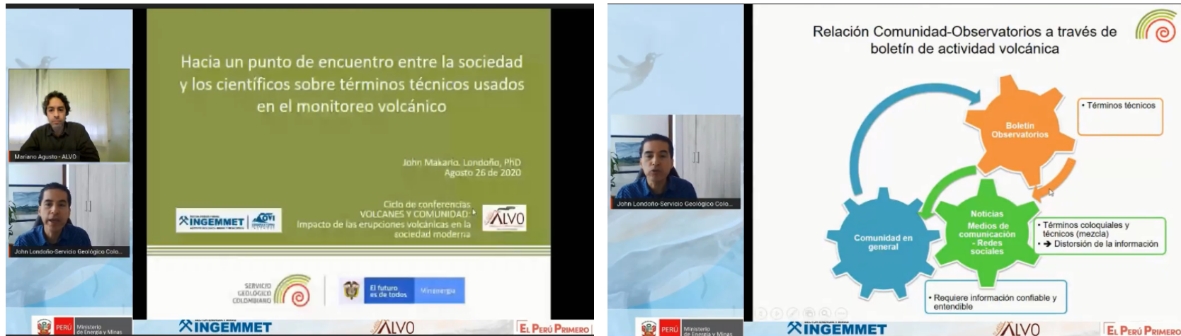
Imagen 1: Ciclo de conferencias Volcanes y Comunidad: Impacto de las erupciones volcánicas en la sociedad moderna